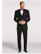
Pronto Uomo Black Notch Lapel Suit