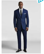
Calvin Klein Blue Suit