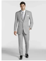
Joseph Abboud Light Gray Satin Edged Notch Lapel