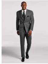
Joseph Abboud Dark Gray Satin Edged Notch Lapel