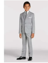
Joseph & Feiss Boy's Gray Suit